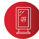
SERVICES DE TRANSPORT