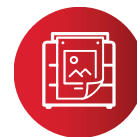
ATELIERS D'IMPRESSION PROFESSIONNELS