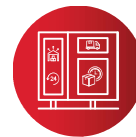
SERVICES DE DISTRIBUTION